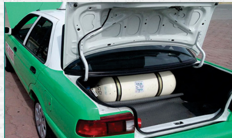
Servicio de conversión especializado de Gasolina a Gas y estaciones de carburación