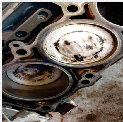
Pistones y Camisas