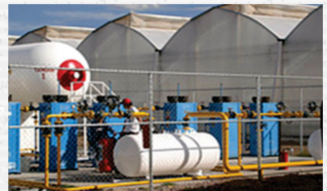
Servicio de ingeniería y proyectos.