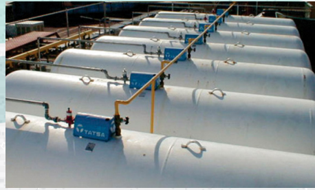
Servicio comercial e industrial.