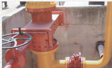
Mantenimiento e instalaciones.