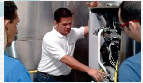
Servicio técnico y capacitación.