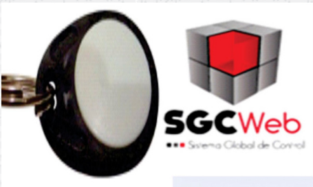
Servicio de administración de flotillas automotrices.