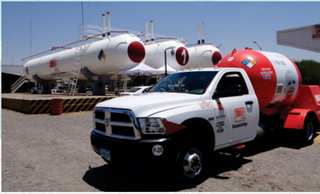
Servicio domestico estacionario y cilindros.