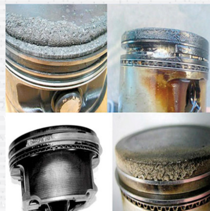
Ejemplo de pistones gastados por Gasolina